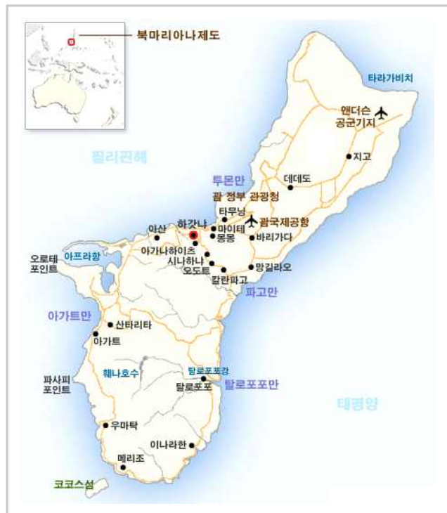
■ 괌섬의 지리적 위치 및 전도 ■