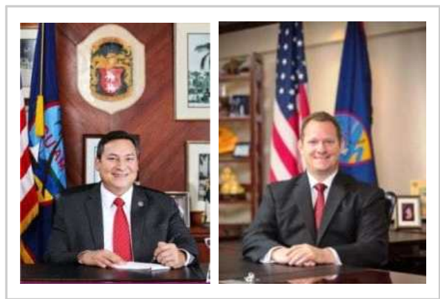
▮ 꺄 준주의 현직 지사(좌)과 부지사(우) ▮