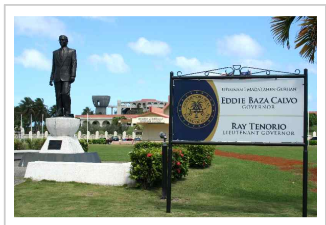
▮ 지사와 부지사 이름이 적힌 청사 입구 안내판 ▮