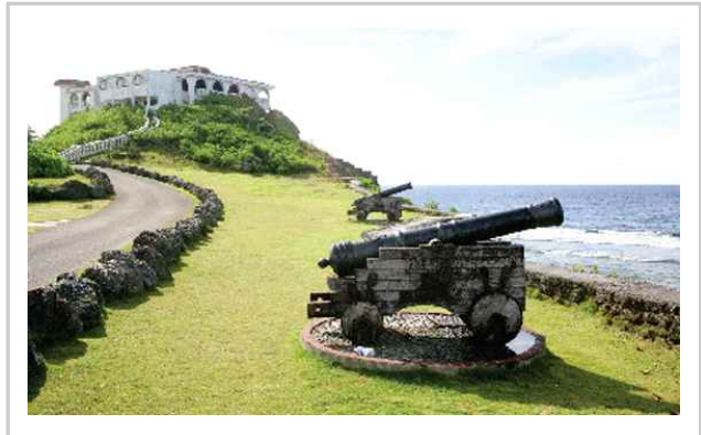
■ 청사 부지 내 2차 세계대전 당시 쓰였던 대포 ■