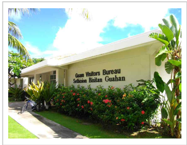
■ 괌 관광청 청사 전경 ■