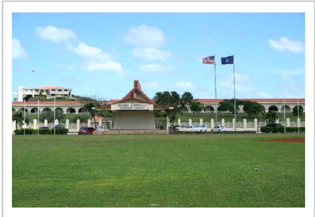
■ 괌 준주 정부청사 전경 ■

- 제34대 괌 입법부(2016년~현재)는 민주당 9명, 공화당 6명의 의원으로 구성되며, 수장은 민주당 소속의 벤자민 크루즈(Benjamin Cruz)