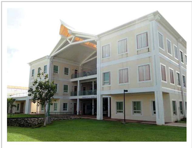
▶ Humanities & Social Sciences Building ▶