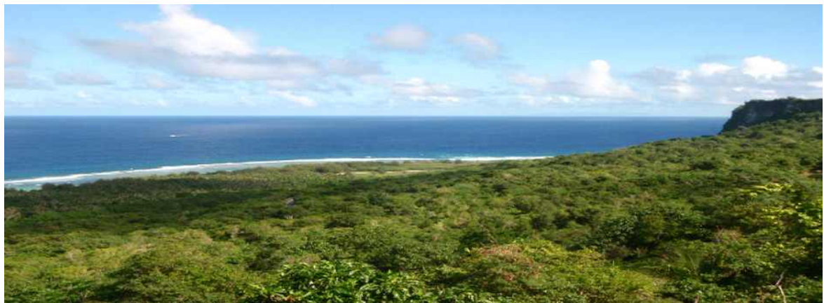
■ 리티비안 포인트 전망대에서 바라본 국립 야생동물 보호구역 전경 ■