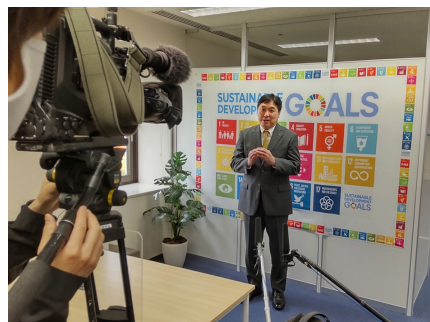
| 그림 4 | 인터뷰중인 사이트 구청장