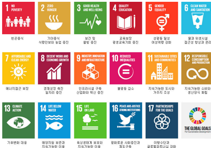
| 그림 1 | SDGs 17개 국제목표