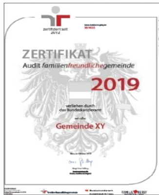
Zertifikat familienfreundliche Gemeinde