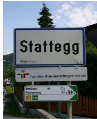
Anbringung der Ortstafel - Beispiel Gemeinde Stattegg (Stmk)