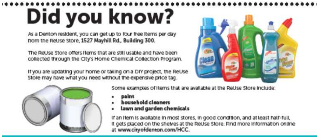
| 그림 1 | 덴튼 시의 Home Chemical Collection 프로그램 개요