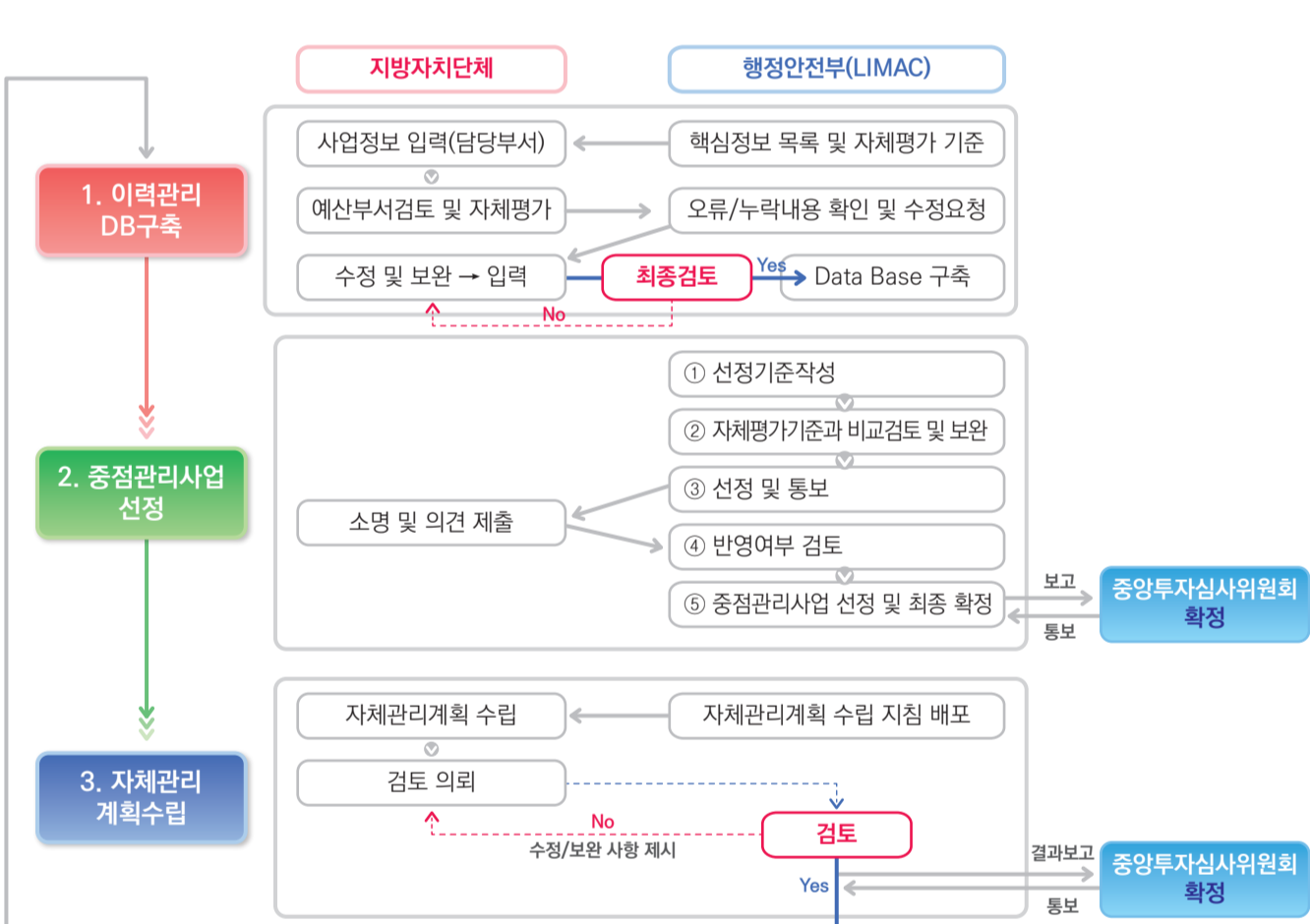
〈그림 2〉 이력관리제도 추진절차